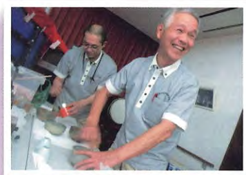
一杯飲んで行かんね~!?

各部所で観月会が行われました。手作りのお月様を見ながらお抹茶とお菓子を頂きました。皆様素敵な笑顔ですね。