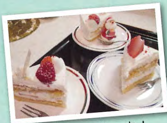
クリスマスケーキ！