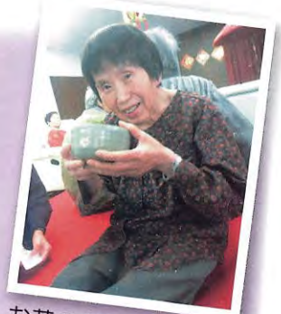
お茶のおいしかよ~!