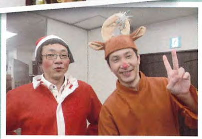
スタッフもサンタに変身！