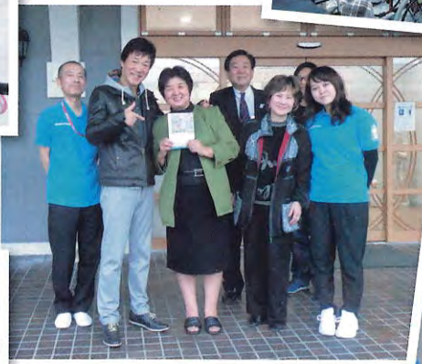
虹のキャラバンの皆様