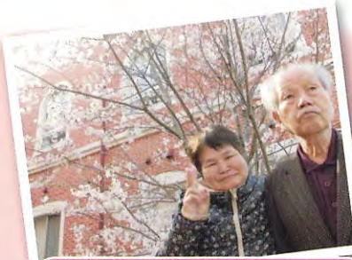
グランパランでお花見。

春… 今年も待ちに待った桜の時期がやって参りました。桜の下でお弁当を食べたり、お花見ドライブへ行ったり…。天候にも恵まれ、青空に桜のピンク色が映えてとても綺麗でした。利用者様も目を細め「きれいかねえ」と素敵な笑顔。来年もまたお花見いきましょうね！