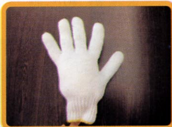
①. 軍手に綿をつめます。