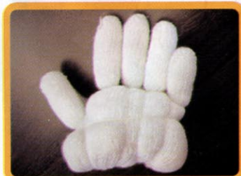
②. タコ糸で5本の指を固く縛った後、俵の形を作るように巻きつけます。