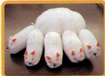
③. 軍手の指の先にビーズをボンドで付け黒糸でひげをつけます。