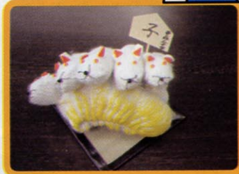
⑤. 俵に色をぬり完成です！ 今年はねずみ年。 皆さんも縁起物のネズミの置物作ってみませんか？