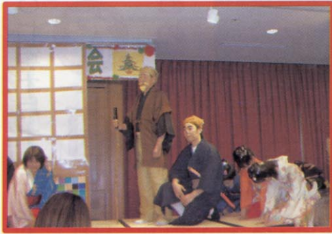
理事長が黄門様になって一行と旅をするのも3年目。今回の旅は??

今年、グランパランいまりクリスマス会名物、『水戸黄門様の爆笑珍道中の劇』はもちろん、グランパランのキレイどころ(?)による『ハンドベル演奏』等、皆様とても楽しまれていました。そして、出し物の中でも一番の盛り上がりを見せたのが、『二人羽織り』。大量のケチャップやからしが混入(笑)する中、めげる事なく食べているスタッフに会場全体笑いの嵐。 ある利用者様は、「二人羽織りが一番面白かった。声が枯れる程大笑いした」ととても大喜びされていました。 このような皆様からのお声を聞くと次回のクリスマス会も、さらにグレードアップして開催したくなります。来年もお楽しみに★☆☆。